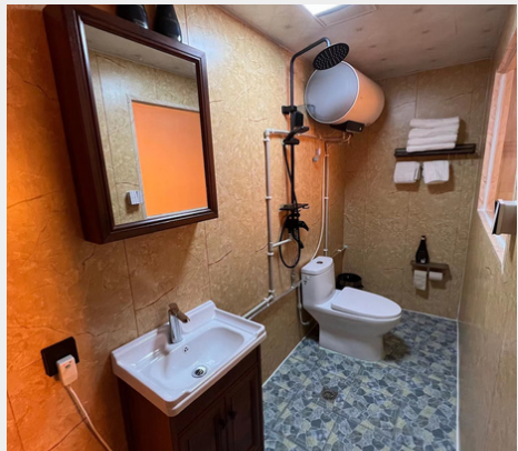
Auberge de notre partenaire Kunchok dans le Kham (salle de bain style local avec eau chaude courante)

Dans les régions plus reculées , les bonnes auberges vous proposeront soit une salle de bain de ce type, soit pas de salle de bain du tout. Dans ce cas-là, il sera possible de se laver le visage dans une salle de bain commune , qui sera équipée de robinets . L'eau sera généralement froide .